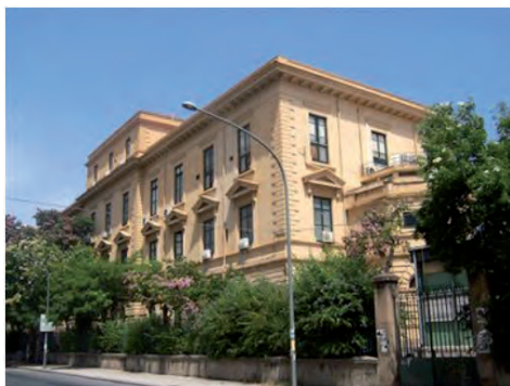
Fig. 1. Dipartimento di Fisica e Chimica dell'Università di Palermo, sede di via Archirafi 36

La collezione è in maggior parte conservata in vetrine (Fig. 2) ubicate nei corridoi e nella direzione del Dipartimento di Fisica e Chimica nella sede di via Archirafi 36, che fu sede del Dipartimento di Fisica dal 1934. 1 Le vetrine in cui sono esposti gli strumenti risalgono allo stesso periodo di costruzione dell'edificio, cioè al 1920 circa.