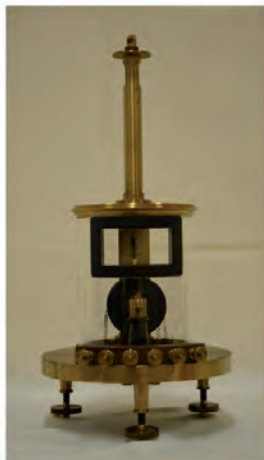
Galvanometro di Siemens (1892)

Tra la fine dell'Ottocento e l'inizio del Novecento la ricerca era orientata allo studio dei fenomeni elettromagnetici e della luce.