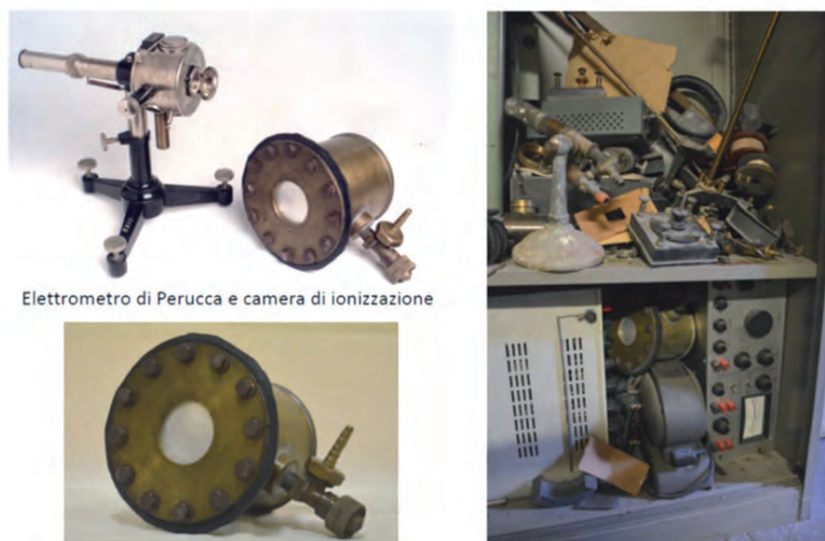
Fig. 7. L'elettrometro di Perucca, la camera di ionizzazione e il luogo in cui sono stati ritrovati

Grazie alla collaborazione tra Segrè e il professore Carlo Perrier 13 (Torino 1886-Genova 1948), direttore dell'Istituto di Mineralogia, 14 fu scoperto proprio in quegli anni, nel 1937, un nuovo elemento chimico: il tecnezio. 15