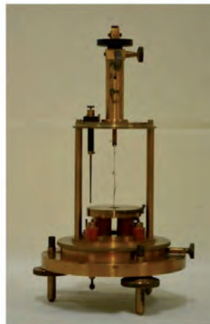
Elettrometro di Dolezalek (1906)