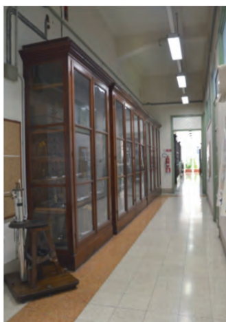
Fig. 2. Vetrine che ospitano la collezione nei corridoi al primo piano dell'edificio

La collezione è in maggior parte conservata in vetrine (Fig. 2) ubicate nei corridoi e nella direzione del Dipartimento di Fisica e Chimica nella sede di via Archirafi 36, che fu sede del Dipartimento di Fisica dal 1934. 1 Le vetrine in cui sono esposti gli strumenti risalgono allo stesso periodo di costruzione dell'edificio, cioè al 1920 circa.