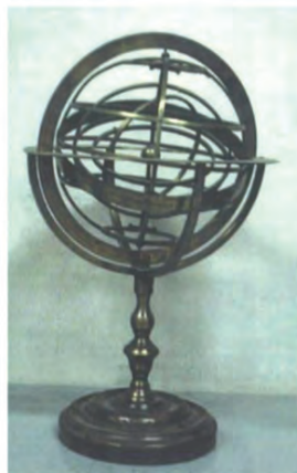
Sfera armillare (1850 circa)

Tra i circa cinquanta strumenti di questo periodo appartenenti alla collezione (Fig. 4), i più rappresentativi sono la sfera armillare, attualmente scelta come logo della collezione, il tubo per la caduta nel vuoto, il piano inclinato, alcuni conduttori, gli emisferi di Cavendish e il doppio cono, che permettevano di svolgere semplici esperimenti per gli studenti.