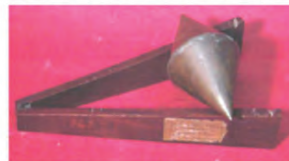
Doppio cono (1850 circa)