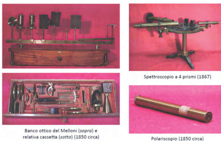
Fig. 5. Alcuni strumenti della Collezione databili al periodo della direzione Blaserna

All'interno della collezione si trovano un centinaio di strumenti databili intorno al periodo della direzione Blaserna (Fig. 5).