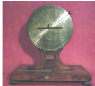
Rifrattometro di Caruso (1843)